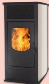
DA VINCI 140 (14 kW) steel