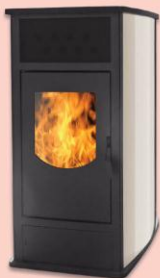
DA VINCI 140 (14 kW) steel

The pellet stoves "DA VINCI" are a italian-bulgarian joint project. The stoves are in compliance with the European law EN 14 785 regarding safety, Electromagnetic compatibility, manufacture and exhaust emissions in respect of the environment, and are certified by CE. There are produce for air and water heating systems in the following models : 14kW, 18 kW and 22 kW .