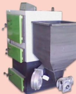
DA VINCI 140 (14 kW) steel