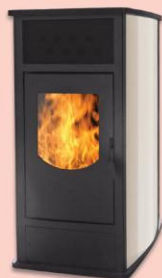
DA VINCI 140 (14 kW) steel